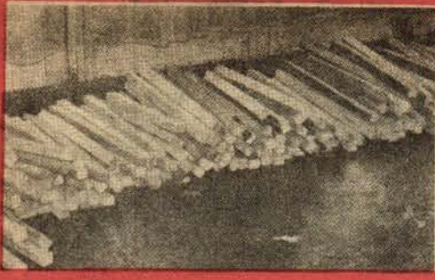
Resimde görülen sopalar mitingdeki görevlilerin elinde bulunuyordu. Bu gürgen sopalar özel olarak yaptırılmış ve devrimcilere saldırmak için kullanılmıştır.