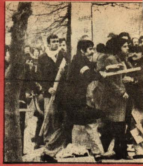
İGD'li beslemeler saldırı hazırlığı yapıyorlar. Resimde esas saldırganlar görülmektedir.