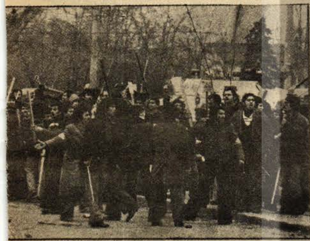
Yurtuluş meydanında mitingün son anlarında çekilen resim, sosyal-faşistlerin panzeri arkalarına alarak devrimcilerle nasıl saldırdıklarını gösteriyor.

"Maocu bozkurtları yerle bir etme günüdür" çağrısı yerine getiriliyordu. Bu ilk yurtsever grubunun çökmüşünden sonra polis barikatı açıldı ve bir up yurtsever daha alana girdi. Polis gene aynı taktiği izledi ve kitleyi bir kere daha bölerek revizyonistlerin saldırısına yardımcı oldu. Yürüyüşü sağlayacağı sırada girişilen revizyonist saldırı ise üzerler tarafından desteklendi. Aynı taktik 1969 yılında "Kanlı Pazar" diye bilinen gerici saldırısı sırasında uygulanmıştı.